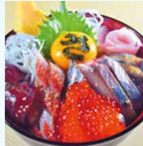
当店イチオシの特選さじるし海鮮丼