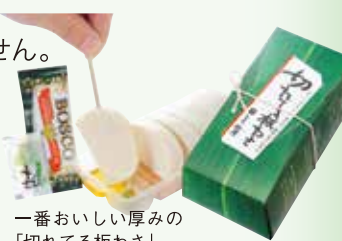
一番おいしい厚みの「切れてる板わか」