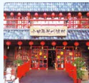
海鮮BBQも地魚丼も必食！