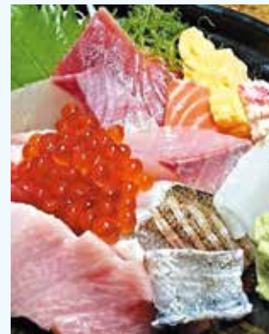
新鮮魚介がたっぷりの海鮮丼