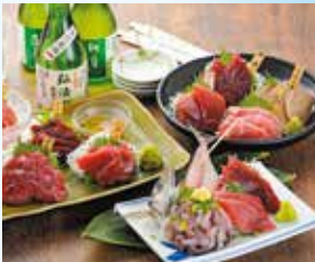
まぐろは部位ごとに味の違いが楽しめる