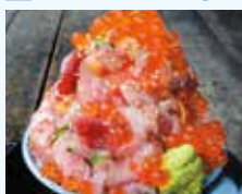
器からあふれそうな「とと丸頂上丼」