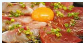
特製だし醤油を使った一番人気「なみ漬け丼」