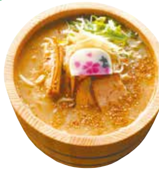
同店の定番の「鯨醤油ラーメン」 (1,000円)

📍 小田原市本町 3-5-22 📍 小田急線・JR東海道本線小田原駅東口から徒歩15分 🕒 11時～16時 ※スープがなくなり次第終了 📅 月曜(祝日の場合営業) MAP P7-A