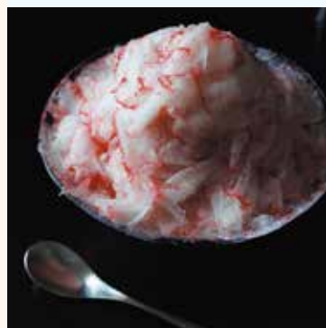
写真のいちごを含めメニューは7種類