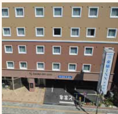
小田原城天守閣へも徒歩5分ほどで行ける

📍 小田原市栄町1-6-7 🚗 小田急線・JR東海道本線小田原駅東口から徒歩3分 🕒 16時～10時 MAP P7-A