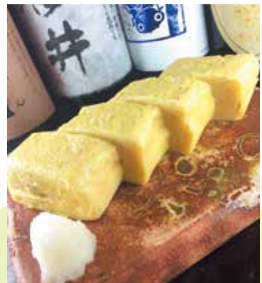
一番人気、ふわとろ食感の「洞のだし巻き玉子」 (748円)

📍 小田原市栄町 2-5-5 📍 小田急線・JR東海道本線小田原駅東口から徒歩3分 🕒 17時～23時 📅 日曜 MAP P7-A