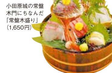
小田原城の常盤木門にちなんで「常盤木盛り」 (1,650円)

📍 小田原市栄町 1-1-9 小田原ビル「ラスカ小田原」2F 📍 小田急線・JR東海道本線小田原駅東口直結 🕒 11時～22時 📅 ラスカ小田原に準ずる MAP P7-A