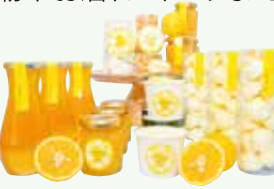
人気の「小田原ゴールドシリーズ」