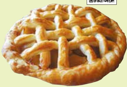
旬のリンゴを使う看板スイーツのアップルパイ

📍 小田原市城山 3-25-19 📍 小田急線・JR東海道本線小田原駅西口から徒歩10分 🕒 11時～17時 📅 土・日曜 MAP P7-A