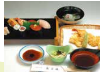
すしと天ぷらがつく達磨 B (2,310円)

📍 小田原市本町 2-1-30 📍 小田急線・JR東海道本線小田原駅東口から徒歩8分 🕒 1階食堂 11時～20時LO、階上お座敷 11時～19時最終入店 📅 1月1日～3日 🚗 駐車場 40台 MAP P7-A