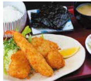
定食は地魚を中心にその日のおすすめ魚を焼・揚・煮の調理法から選べる

📍 小田原市栄町 2-3-4 美ゆ紀ビル1F 📍 小田急線・JR東海道本線小田原駅東口から徒歩1分 🕒 ランチ 11時～14時、ディナー 16時～22時 📅 日曜 MAP P7-A