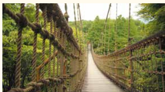
子どもに大人気の大型遊具をそろえたこどもの森公園わんぱくらんど