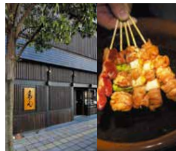
昭和46年開店。創業より継ぎ足しのタレは素材を引きだすつつも深い味わい

📍 神奈川県 小田原市 栄町 1-14-5 📍 小田急線・JR東海道本線小田原駅東口から徒歩3分 🕒 11時30分～22時 (21時LO)、ランチは15時まで 📅 不定休 MAP P7-A