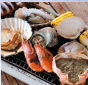
購入した魚介を焼いて食べられるBBQ